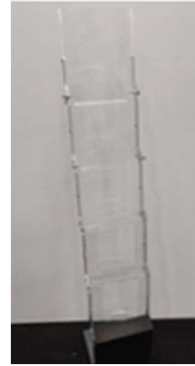
Porta-Folhetos Acrilico 21€ + iva