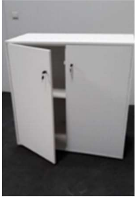
BLP 1 – Balcão c/ e s/ Portas 1*1*50 135€ + iva