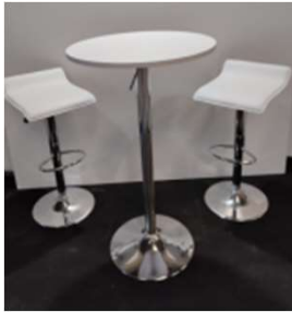
Conjunto 1 75€ + iva