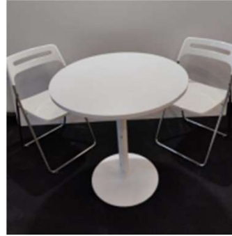
Conjunto 5 75€ + iva